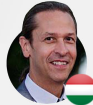
Sándor Bussy Gold Diamond