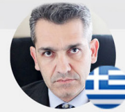
Cris Thanasainas Sen. Star Diamond